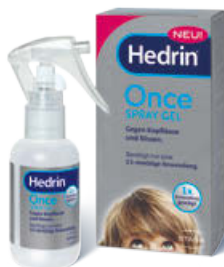
Hedrin® Once Spray Gel, 60 ml Ausreichend für 2 Anwendungen