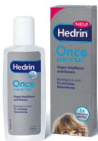
Hedrin® Once Liquid Gel, 100 ml Ausreichend für 4 Anwendungen

Inzwischen stehen nicht nur Arzneimittel auf Insektizidbasis, sondern auch verschiedene Produkte zur Verfügung, die auf physikalische Weise Läuse und Läuseeier töten und für den Menschen dennoch gut verträglich sind.