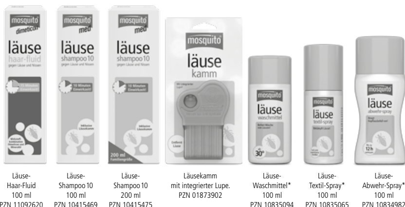
Läuse-Haar-Fluid 100 ml PZN 11092620

Restentleerte Behälter der Wertoffsammlung zuführen.