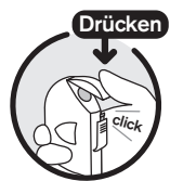
Schließen Verschlusskappe nach unten drücken

Wenn Sie in Versuchung kommen, wieder mit dem Rauchen zu beginnen