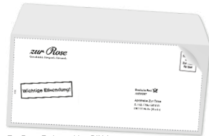
Zur Rose Freiumschlag DIN-Lang zum Ausdrucken und Aufkleben