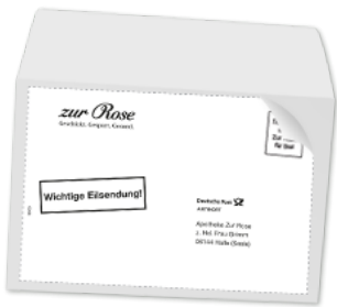
Zur Rose Freiumschlag C6 zum Ausdrucken und Aufkleben